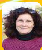
JEUGDTOERNOOIEN FRIENDLY MATCHES